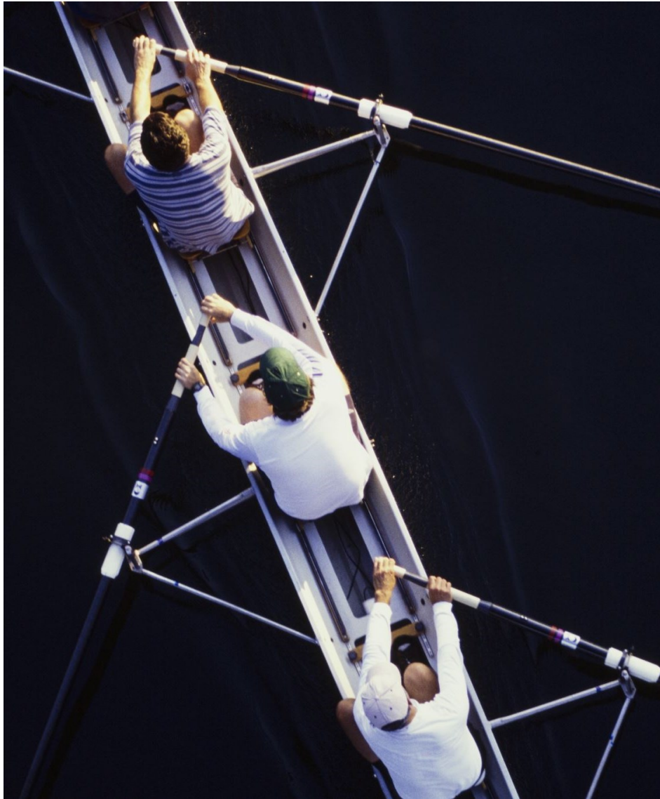
Défi n°3 autour de la convergence