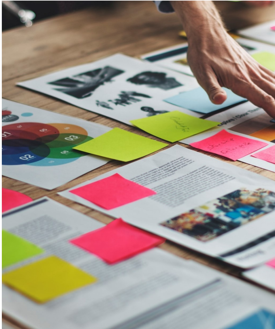
Défi n°4 autour des approches spécifiques par ODD

☞ La Place ne dispose pas à ce jour d'un socle méthodologique commun, nécessaire à l'instauration d'une pratique impact ni d'outils de référence :